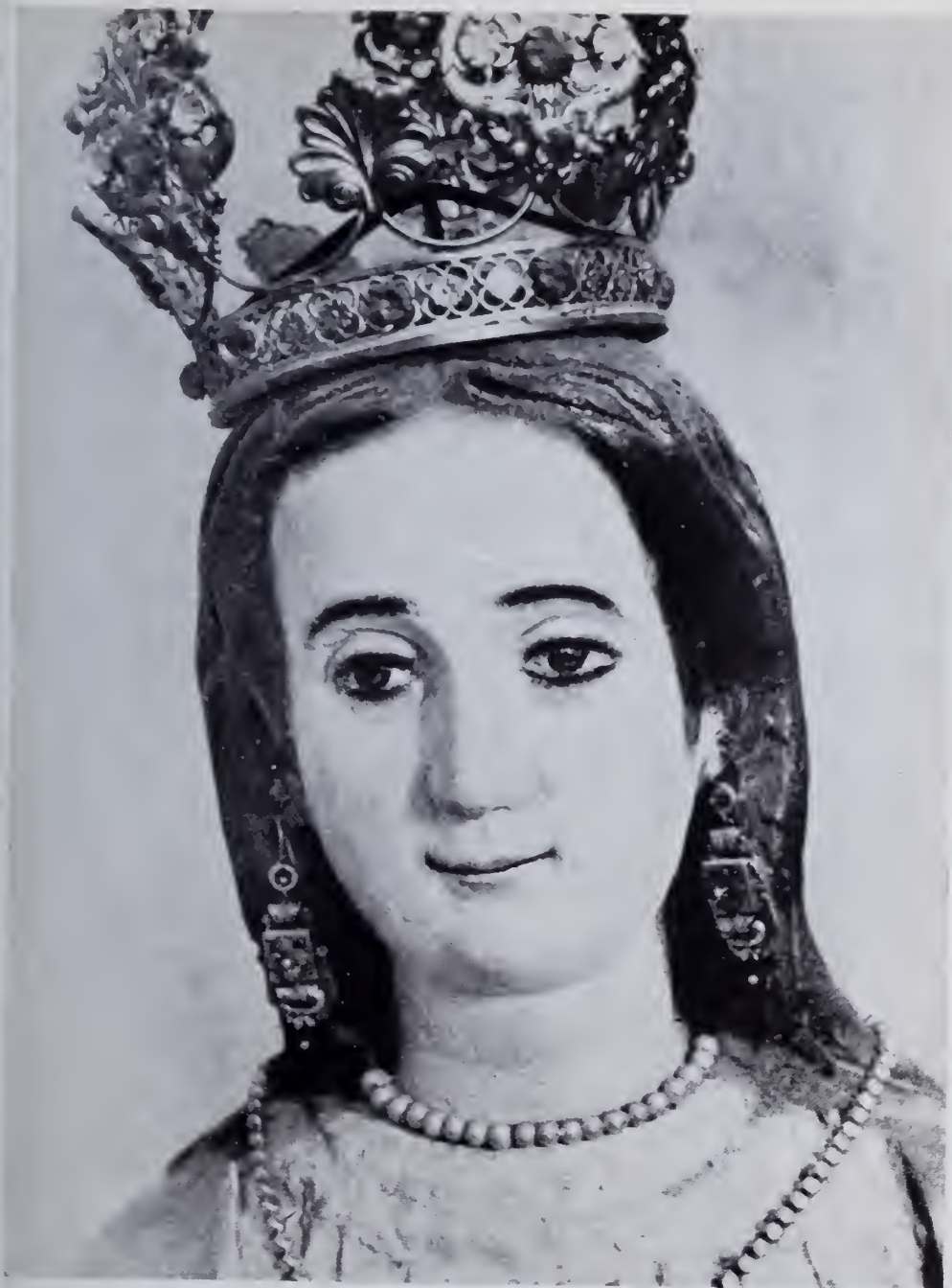
Jesús María. La Fundadora y titular de la casa. "La Pura y Limpia Concepción". Tallada en algarrobo.

☞ Jesús María. El corredor del lado Sud, adosado a la Iglesia.